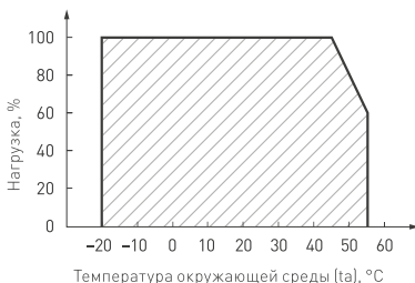
Рис. 3. Максимальная допустимая нагрузка, % от мощности источника