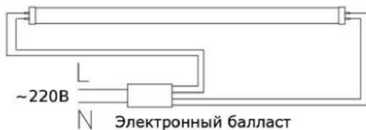
Рис.2. Схема люминесцентного светильник с электронным балластом