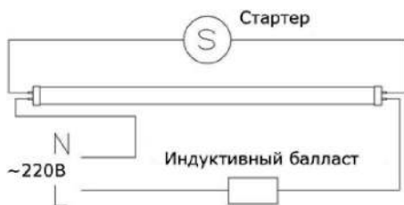
Рис.1. Схема люминесцентного светильник с индуктивным балластом