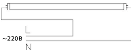
Рис.3. Схема подключения светодиодной лампы