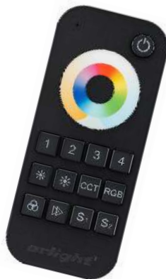
SMART-R22-MULTI Black Арт. 023473