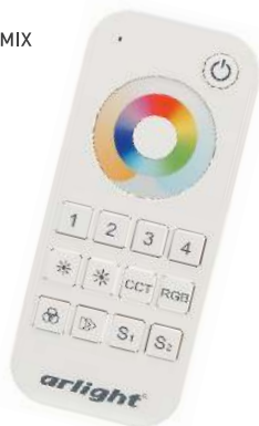
SMART-R20-MULTI White Арт. 023471