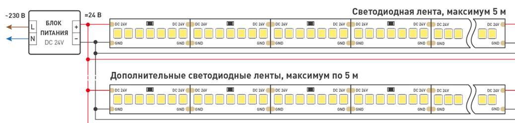
Схема 2. Подключение нескольких светодиодных лент с двух сторон. Рекомендуется использовать для обеспечения равномерного свечения ленты по всей длине.