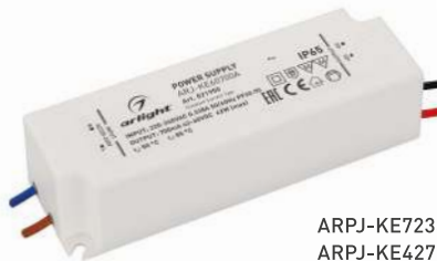
ARPJ-KE72350A ARPJ-KE42700A ARPJ-KE60700A ARPJ-KE401050A