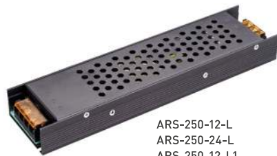
ARS-250-12-L ARS-250-24-L ARS-250-12-L1 ARS-250-24-L1