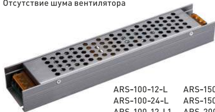
ARS-100-12-L ARS-150-12-L ARS-100-24-L ARS-150-24-L ARS-100-12-L1 ARS-200-12-L ARS-100-24-L1 ARS-200-24-L