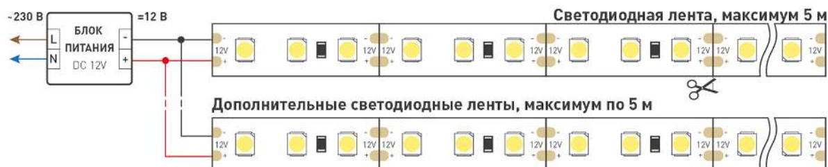
Схема 1. Подключение нескольких светодиодных лент с одной стороны.

Максимальная длина подключения ленты – 5 м (1 катушка).