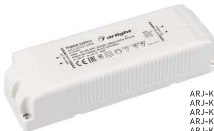
ARJ-KE70700 ARJ-KE86700 ARJ-KE481050 ARJ-KE571050 ARJ-KE301400 ARJ-KE361400 ARJ-KE421400A