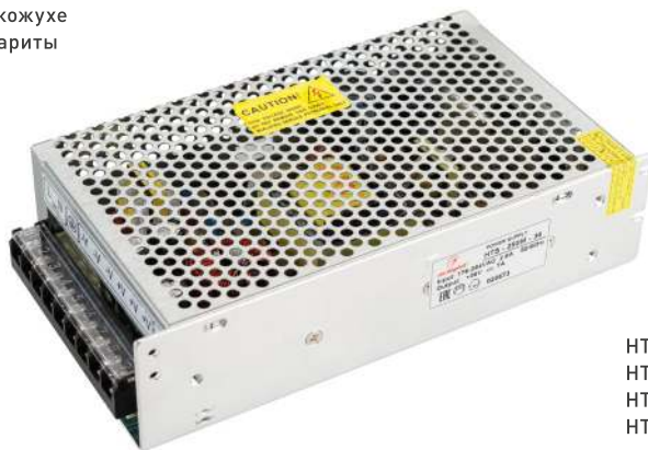
HTS-250M-12 HTS-250M-24 HTS-250M-36 HTS-250M-48