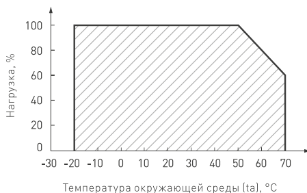
Рисунок 2. Максимальная допустимая нагрузка, % от мощности источника